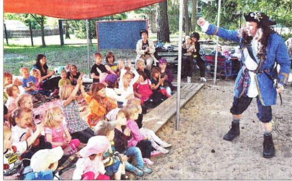
„Käpt'n Blaubeere“ feuert die Kinder an, selbst Piraten zu werden.

von Robinson Crusoe. Aber in moderner Version – ausgedacht von Veronika Schilling aus Kümmernitz. Das Blaue Herz erzählt sie den Kindern: Robinson stürzt mit seinem Hubschrauber auf einer Insel ab. Er landet bei den Affen und singt mit ihnen zusammen. Hier erklingt dann auch das Affenlied, das genau wie andere Lieder der Show aus der Feder von Heiko Kurze stammt. Die Kletzter Kinder können mitsingen und sich passend zum Text be-